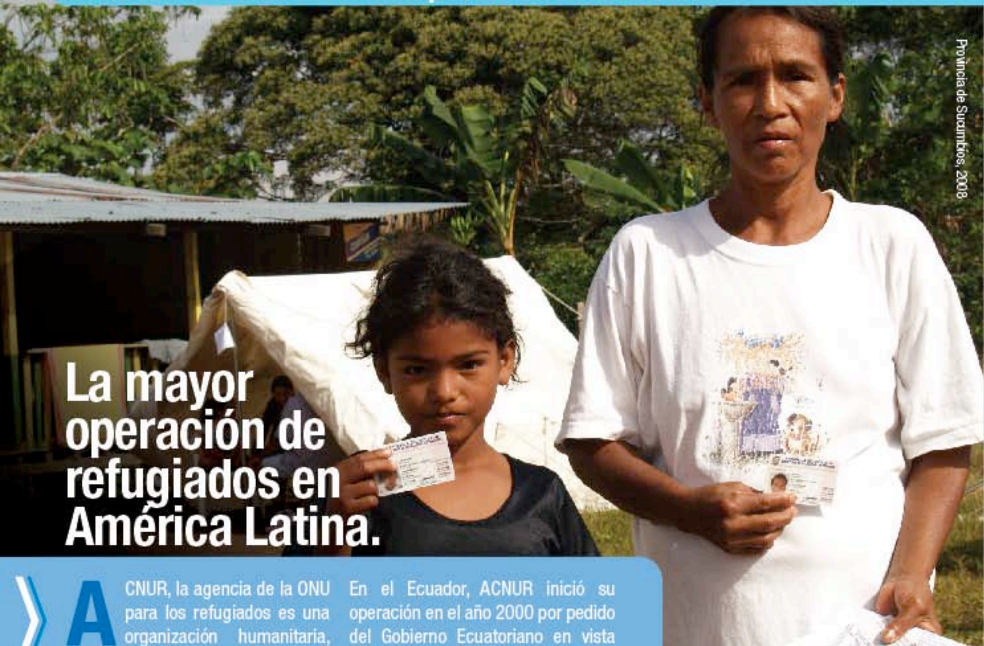
Provincia de Sucumbios, 2008

Datos básicos sobre la operación de ACNUR