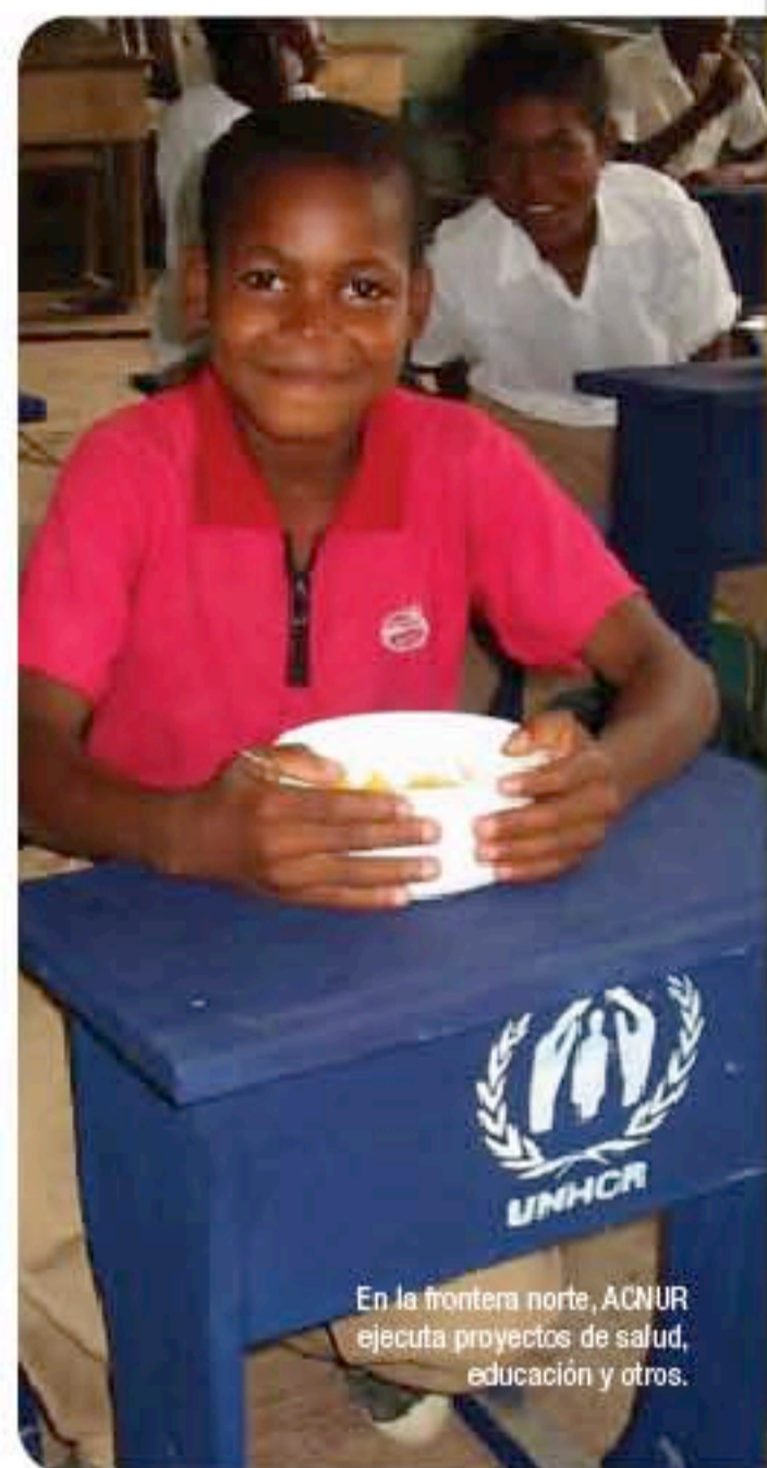
En la frontera norte, ACNUR ejecuta proyectos de salud, educación y otros.

Una serie de ONGs conforman la red de socios de ACNUR en el Ecuador. Con la sociedad civil ACNUR participa en espacios de incidencia y promueve esfuerzos para conseguir mejor acceso de la población refugiada a sus derechos.