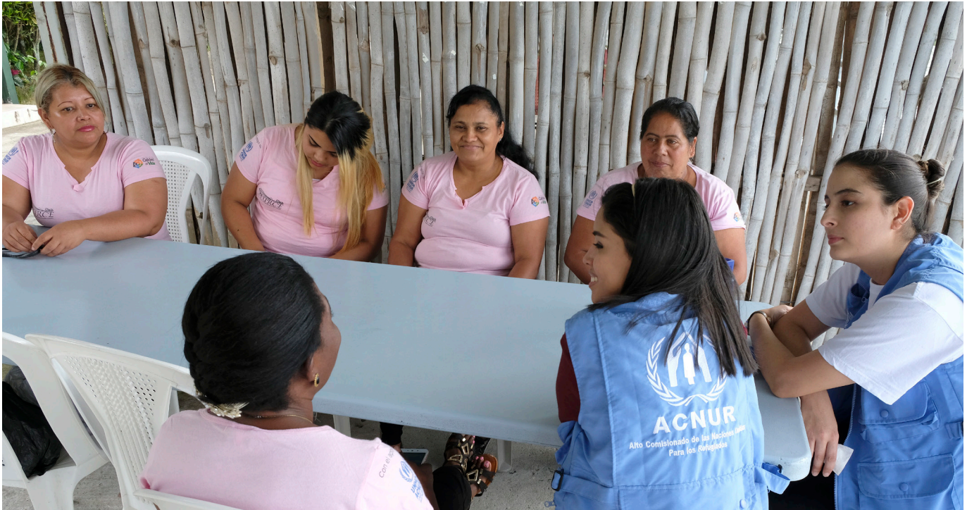
Honduras. Ayudando a las comunidades urbanas afectadas por la violencia de las pandillas.

El presente documento tiene como finalidad ofrecer una visión general de los principales acontecimientos que afectan a la situación de desplazamiento en las Américas y a algunas de las actividades de respuesta del ACNUR con arreglo a los objetivos estratégicos de 2019 para la región.