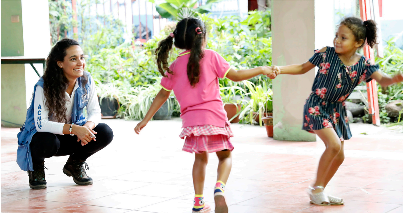
Costa Rica. Más de 60.000 nicaragüenses han solicitado asilo en Costa Rica desde abril de 2018.

El presente documento tiene como finalidad ofrecer una visión general de los principales acontecimientos que afectan a la situación de desplazamiento en las Américas y a algunas de las actividades de respuesta del ACNUR con arreglo a los objetivos estratégicos de 2019 para la región.