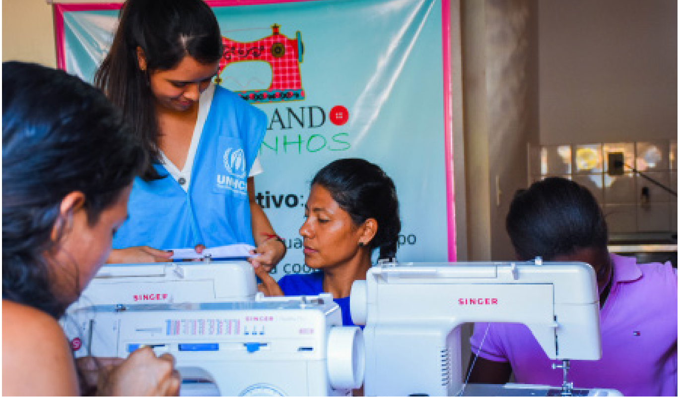
Brasil. Mujeres venezolanas y haitianas completan un curso técnico de costura en Boa Vista.

El presente documento tiene como finalidad ofrecer una visión general de los principales acontecimientos que afectan a la situación de desplazamiento en las Américas y a algunas de las actividades de respuesta del ACNUR con arreglo a los objetivos estratégicos de 2019 para la región.