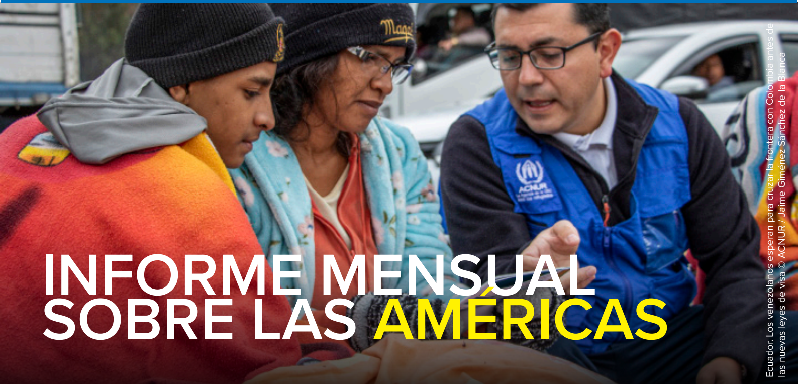
Ecuador. Los venezolanos esperan para cruzar la frontera con Colombia antes de las nuevas leyes de visa