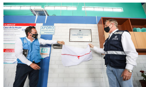
Mira la ceremonia de la inauguración de la “Casa de la Mujer”

ACNUR apoyó a la “Casa de la Mujer” con la instalación de una bio-granja en el refugio seguro administrado por la Municipalidad de Lima que brinda apoyo a sobrevivientes de VBG. El proceso se llevó a cabo mediante un taller participativo sobre terapia ocupacional para mujeres, niñas y niños alojados en el refugio. Esta iniciativa tiene como objetivo fomentar la integración entre las personas refugiadas y la comunidad de acogida, fortalecer las intervenciones sobre VBG, incluyendo el componente de gestión ambiental y residuos.