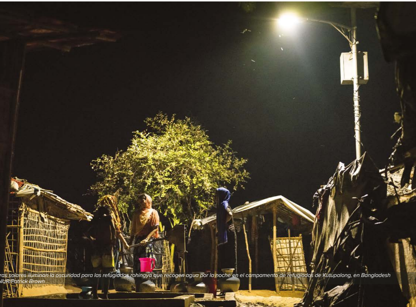
Lámparas solares iluminan la oscuridad para las refugiadas rohingya que recogen agua por la noche en el campamento de refugiados de Kutupalong, en Bangladesh

Ambiental para las Personas Refugiadas (REP, por sus siglas en inglés). El Fondo REP se creará como un mecanismo de financiación sostenible que invierta en programas de reforestación y de cocina limpia a gran escala para las personas refugiadas y las comunidades de acogida, y que los registre como créditos de carbono verificados. La venta de estos “créditos de carbono para personas refugiadas” repondría el fondo, haciéndolo financieramente sostenible a lo largo del tiempo y permitiendo que más personas refugiadas y comunidades de acogida contribuyan a la solución climática global. Dado el ciclo de más de 5 años de los programas de cocina limpia y de más de 10 años de los programas de reforestación, el Fondo REP será una iniciativa a largo plazo.