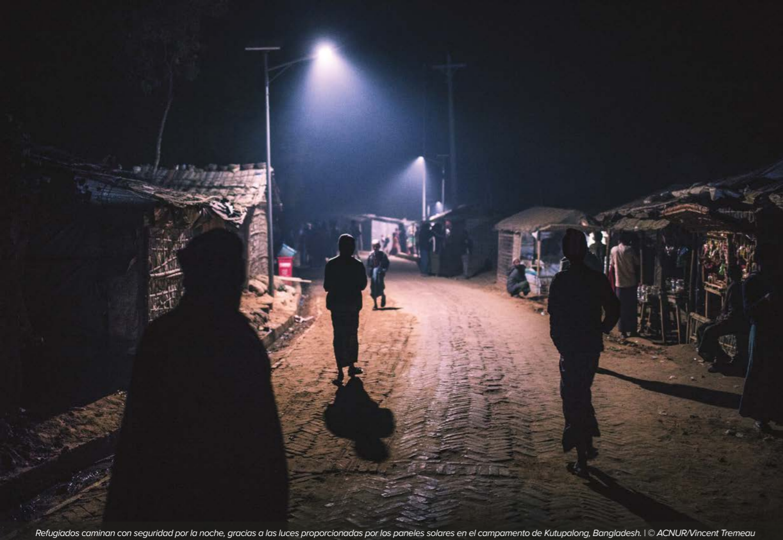
Refugiados caminan con seguridad por la noche, gracias a las luces proporcionadas por los paneles solares en el campamento de Kutupalong, Bangladesh.

En colaboración con sus contrapartes gubernamentales y otros socios, ACNUR dirigirá el análisis de riesgos interinstitucional y la preparación y respuesta multisectorial a las emergencias provocadas por el clima y otros peligros naturales que afecten a las personas refugiadas. En contextos no relacionados con refugiados, incluidas las situaciones de desastres, ACNUR, tanto como líder de grupo(s) temático(s) y como agencia operativa –como miembro del equipo de país de Naciones Unidas y Equipos Humanitarios de País–, se asegurará de que las cuestiones específicas relacionadas con la protección y el desplazamiento se aborden lo antes posible durante la fase de preparación y en la respuesta humanitaria. ACNUR