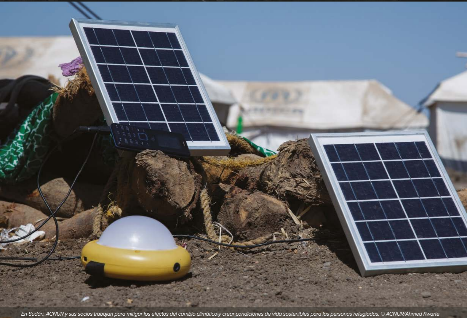
En Sudán, ACNUR y sus socios trabajan para mitigar los efectos del cambio climático y crear condiciones de vida sostenibles para las personas refugiadas.