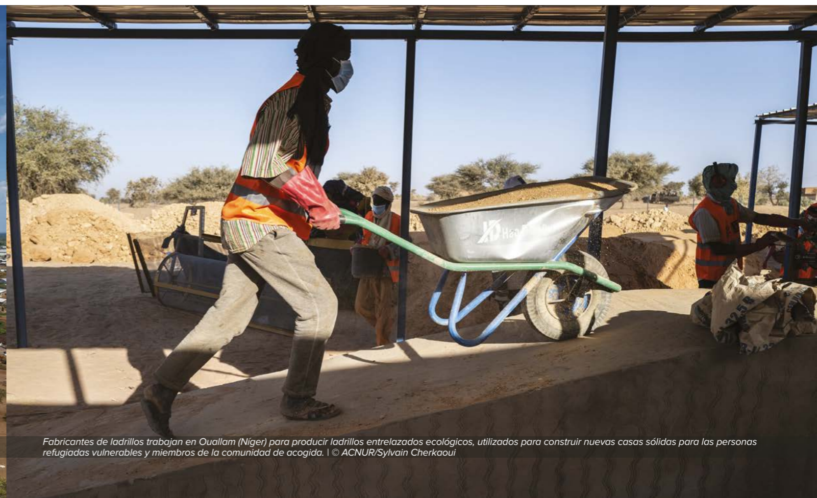
Fabricantes de ladrillos trabajan en Ouallam (Niger) para producir ladrillos entrelazados ecológicos, utilizados para construir nuevas casas sólidas para las personas refugiadas vulnerables y miembros de la comunidad de acogida.

Las respuestas a los albergues de emergencia suelen depender en gran medida del carbono y de los plásticos, que tienen un impacto medioambiental negativo, especialmente durante la distribución de materiales de alojamiento y artículos domésticos adquiridos a nivel internacional o regional. Se buscarán soluciones respetuosas con el medio ambiente mediante un análisis del ciclo de vida de las tiendas familiares estándar, las tiendas familiares autoportantes y las lonas. En colaboración con la FICR y el CICR, ACNUR está trabajando en un proyecto de investigación y desarrollo para mejorar o encontrar soluciones alternativas para el uso de lonas de plástico. Después de la emergencia, ACNUR también buscará oportunidades para utilizar material reciclado y para reciclar o reutilizar los materiales de los albergues de emergencia.