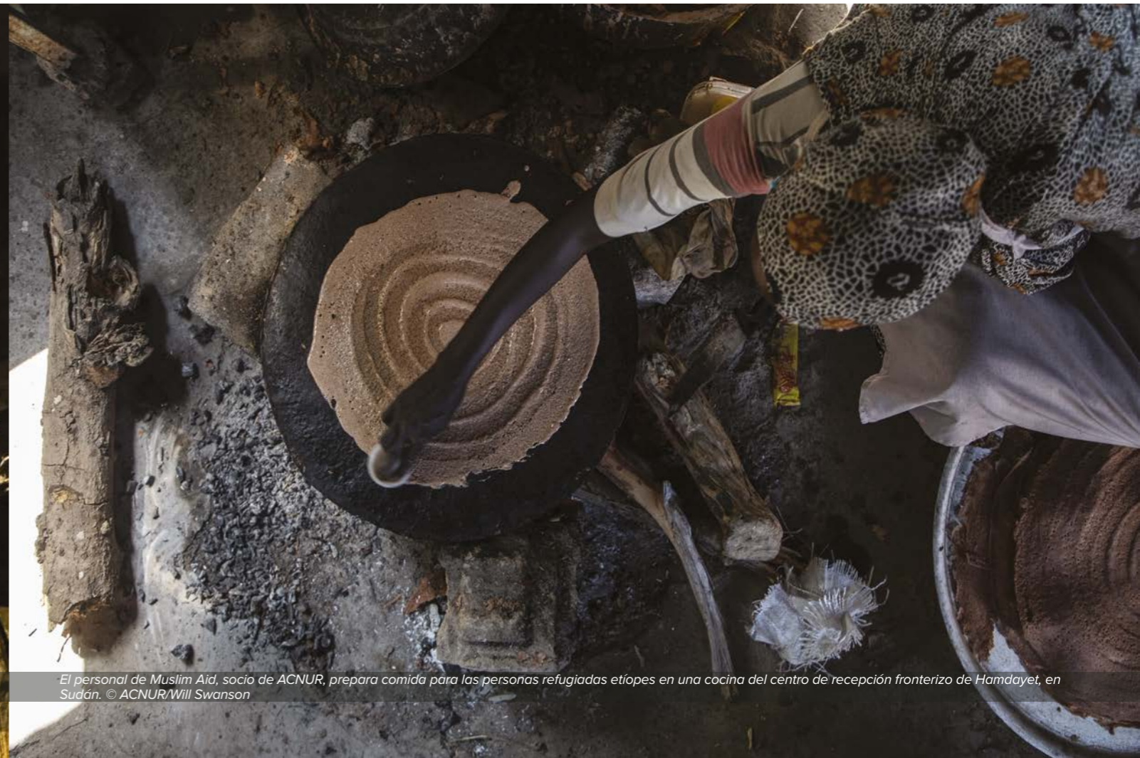
El personal de Muslim Aid, socio de ACNUR, prepara comida para las personas refugiadas etíopes en una cocina del centro de recepción fronterizo de Hamdayet, en Sudán.