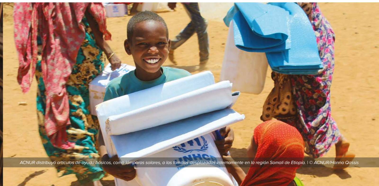
ACNUR distribuyó artículos de ayuda básicos, como lámparas solares, a las familias desplazadas internamente en la región Somalí de Etiopía.