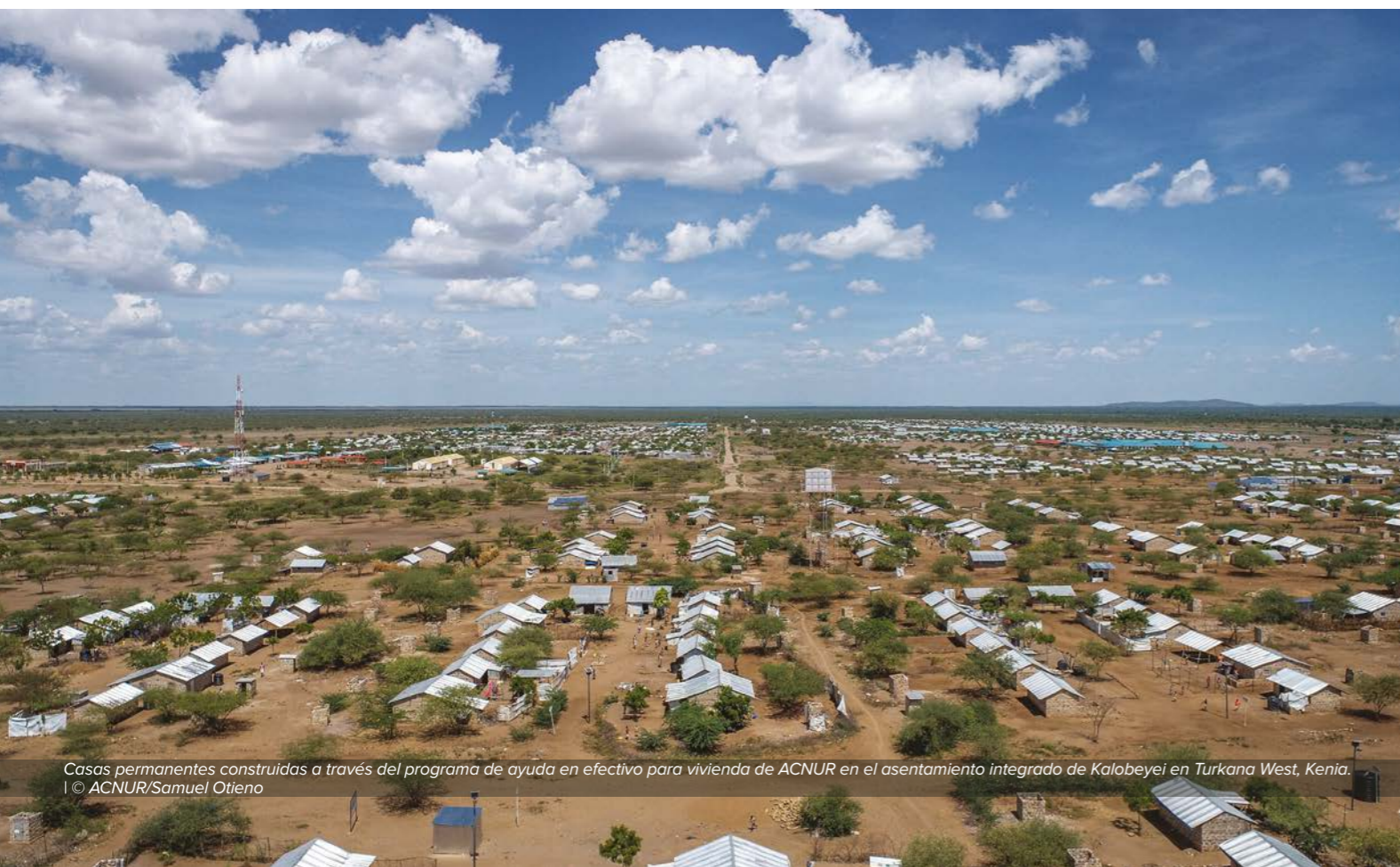
Casas permanentes construidas a través del programa de ayuda en efectivo para vivienda de ACNUR en el asentamiento integrado de Kalobeyei en Turkana West, Kenia.