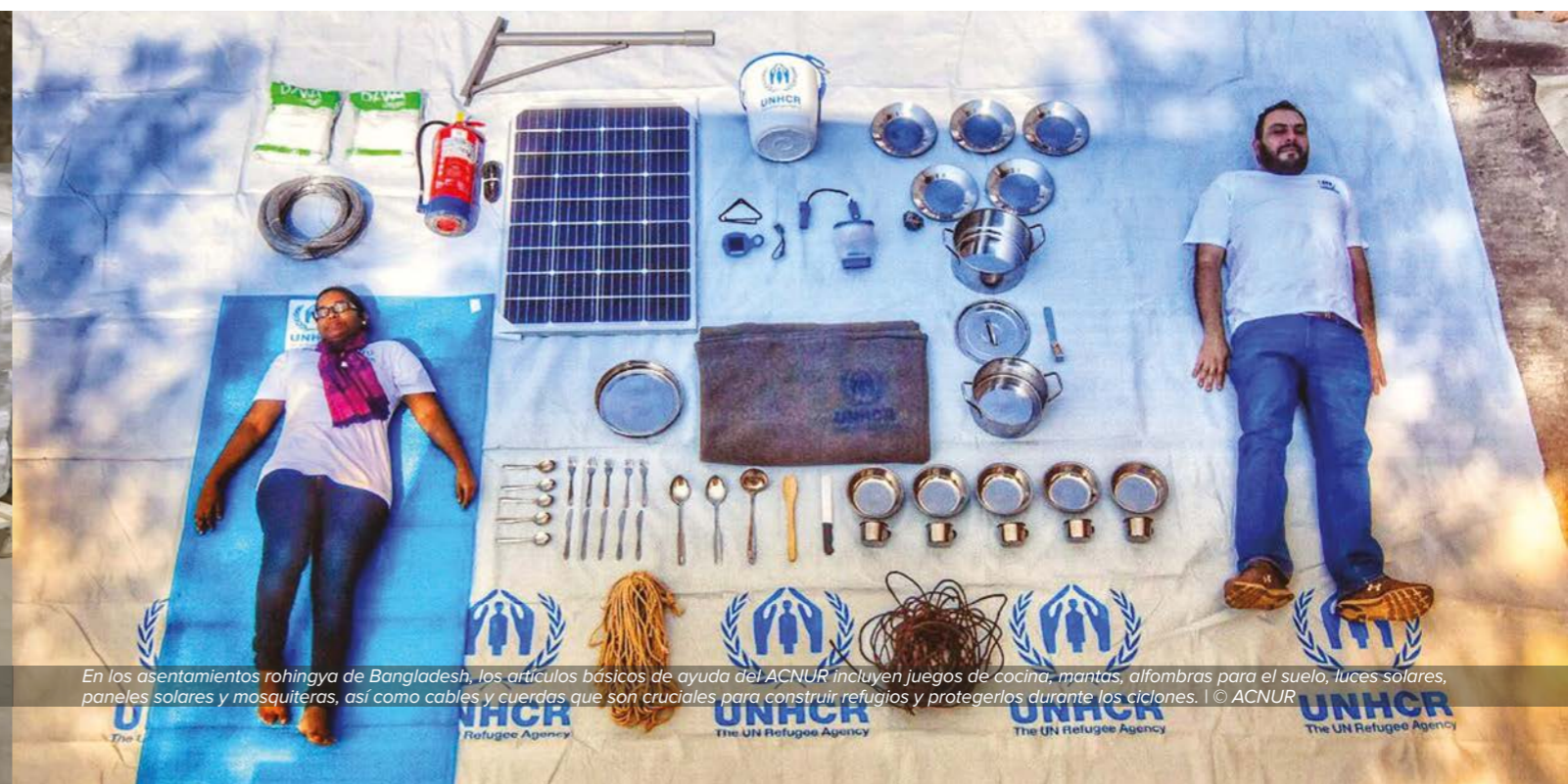
En los asentamientos rohingya de Bangladesh, los artículos básicos de ayuda del ACNUR incluyen juegos de cocina, mantas, alfombras para el suelo, luces solares, paneles solares y mosquiteras, así como cables y cuerdas que son cruciales para construir refugios y protegerlos durante los ciclones.