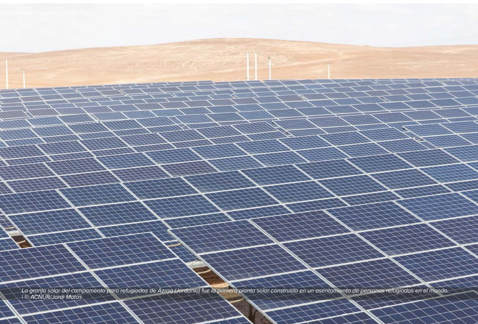
La granja solar del campamento para refugiados de Azraq (Jordania) fue la primera planta solar construida en un asentamiento de personas refugiadas en el mundo.

7 - Estrategia global para la energía sostenible 2019 - 2025