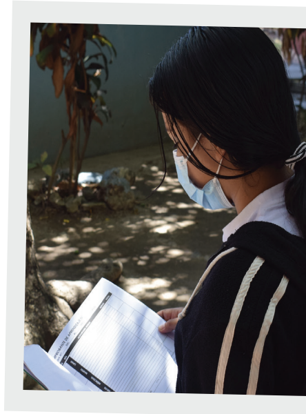
* Name changed for protection reasons

Regina* (18) vio su vida cambiar cuando comenzó a estudiar una carrera técnica en administración de empresas. "Nunca pensé que una madre soltera como yo pudiera ser capaz de estudiar una carrera. Siento que mi autoestima mejoró porque ahora creo en mí misma y en un mejor futuro para mí y mi bebé". ACNUR apoya centros de formación profesional como parte de su estrategia de medios de vida para mejorar las habilidades, calificaciones y empleabilidad de personas desplazadas internas y en riesgo desplazamiento. Además de donar equipos actualizados, ACNUR ayuda con dinero en efectivo para cubrir necesidades básicas como alimentación y transporte de los jóvenes inscritos en los cursos. Los egresados de los cursos obtienen una certificación por parte del Instituto Salvadoreño de Formación Profesional (INSAFORP), lo que mejora sus perspectivas laborales a largo plazo. Gracias al apoyo de ACNUR, Regina* puede cubrir el transporte diario para asistir al curso y contribuir a cubrir las necesidades básicas de su familia mientras cuidan a su bebé.