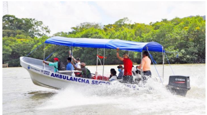
“Ambulancha” circulando hacia comunidades remotas ubicadas a lo largo de la frontera entre Guatemala y Belice.