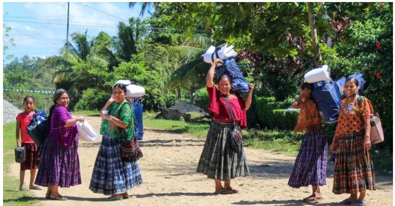
Comadronas en Sayaxché, Petén, portando maletines con equipo médico donado por ACNUR.