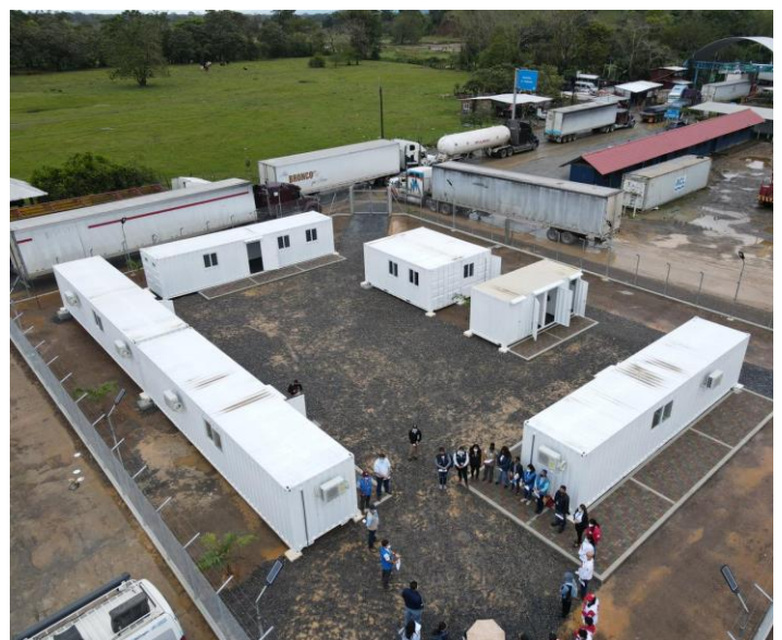
Instalación del nuevo Centro de Atención para Personas Migrantes y Refugiadas (CAPMyR) en la frontera de El Cinchado/El Corinto con Honduras.

En Izabal, se finalizó con la instalación de la infraestructura que albergará el CAPMyR ubicada en la frontera de El Cinchado/El Corinto con Honduras. El Centro es un espacio seguro en el que se proporcionan diferentes servicios a personas desplazadas como información; asesoramiento jurídico; atención médica básica; primeros auxilios psicológicos; kits de higiene; agua; llamadas telefónicas y acceso a wifi.