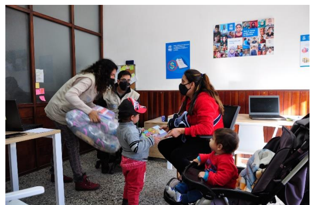
ACNUR y la agencia socia Idas y Vueltas entregan abrigos a familias de refugiados y migrantes que ingresan al territorio uruguayo en el PAO de Chuy.