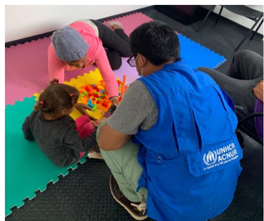
Personas asistidas en el nuevo Centro de Atención a Personas Migrantes y Refugiadas (CAPMiR) en Esquipulas.