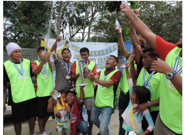
Rally deportivo realizado en Esquipulas para promover la integración a través del deporte.