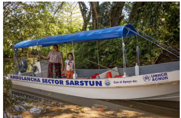
Ambulancia acuática, “Ambulancha” in Izabal.