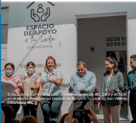
El Alcalde de San Vicente junto a representantes de IRC, DAV y ACNUR en el evento inaugural del Espacio de Apoyo A Tu Lado en San Vicente.

ACNUR apoyó al Instituto para el Desarrollo de la Mujer (ISDEMU) en la inauguración de un Centro de Atención Especializada en Sonsonate, y a través de la donación de 253 kits de higiene y de ropa, en apoyo a mujeres desplazadas sobrevivientes de violencia de género.