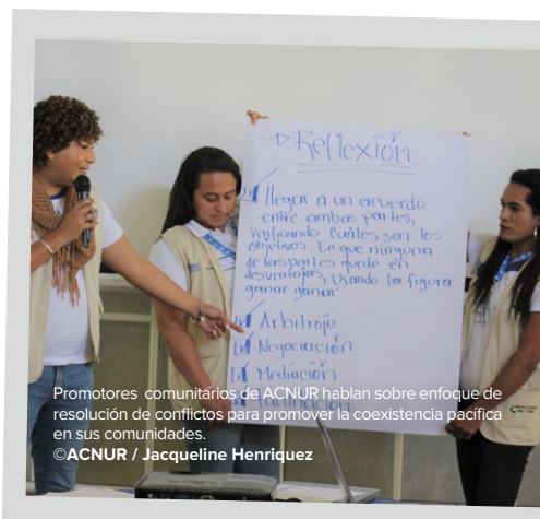
Promotores comunitarios de ACNUR hablan sobre enfoque de resolución de conflictos para promover la coexistencia pacífica en sus comunidades.