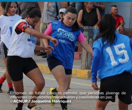
El torneo de fútbol callejero permitió que personas jóvenes de diferentes comunidades interactuaran y coexistieran en paz.

Veintiséis autoridades y promotores comunitarios asistieron a una jornada organizada por ACNUR y COMCAVIS Trans sobre la protección de las personas LGBTIQ+ y la no discriminación. Delegados del Departamento para la Prevención de la Violencia de San Salvador, el Instituto Nacional de la Juventud, la Defensoría del Pueblo, la Procuraduría General de la República y promotores comunitarios estuvieron entre los asistentes.