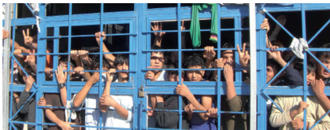
► Jóvenes inmigrantes y solicitantes de asilo hacinados en un centro de detención de la isla griega de Lesbos.

Los conflictos actuales plantean muchos desafíos para las organizaciones humanitarias y la acción humanitaria se ve afectada por muchos factores sobre los que las organizaciones humanitarias tienen poco control. En los últimos años, a pesar de las numerosas limitaciones, ACNUR y sus socios han podido seguir operando en muchos entornos complejos e inseguros. Las tendencias del desplazamiento forzado sugieren que continuará la necesidad, probablemente creciente, de «quedarse y cumplir» en estos contextos, lo que exigirá innovación, disciplina, principios y realismo. Aun así, la acción humanitaria más efectiva sólo puede ser paliativa: abordar las causas fundamentales del desplazamiento forzado requiere otras acciones. Cuando estas no existen, hace falta una mayor solidaridad internacional con los refugiados y los desplazados internos, así como con los países y comunidades de acogida. ■