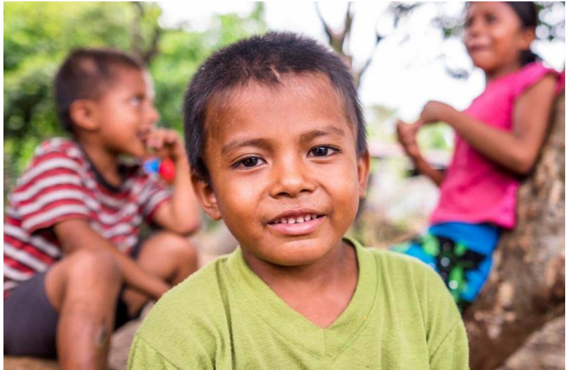
Guatemala. Pueblo en la frontera con México que es popular entre los refugiados

programas sociales y de desarrollo gubernamentales para las personas de interés, especialmente aquellas personas refugiadas y solicitantes de asilo vulnerables de los países del TNC. En 2016, 252 personas de interés provenientes de los países del TNC se beneficiaron del programa Vivir la Integración que es de responsabilidad social corporativa, de las cuales 51 personas han sido contratadas exitosamente, 205 fueron capacitadas, y 106 homologaron sus diplomas de secundaria en el Ministerio de Educación. Además, 119 familias provenientes de los países del TNC se beneficiaron del proyecto de medios de vida denominado Modelo de Graduación.