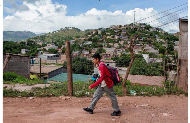
Un estudiante regresa a la casa caminando desde la escuela en la comunidad de La Era en Tegucigalpa, Honduras.