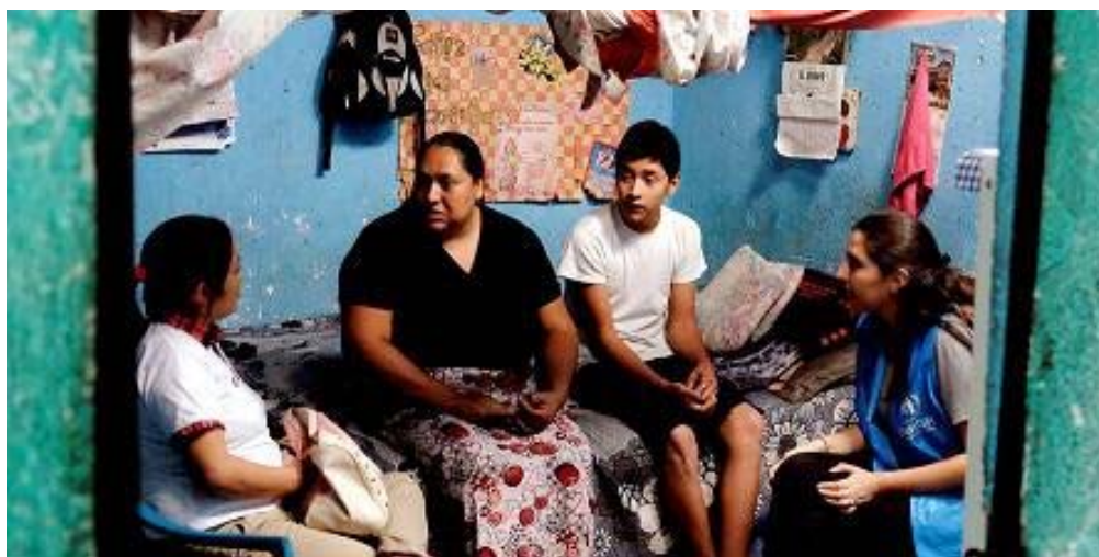
Guatemala. El ACNUR en la Casa del Migrante donde implementa el Proyecto Niños de Paz.