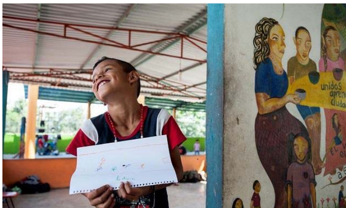
México. Las familias encuentran seguridad en los albergues financiados por el ACNUR.