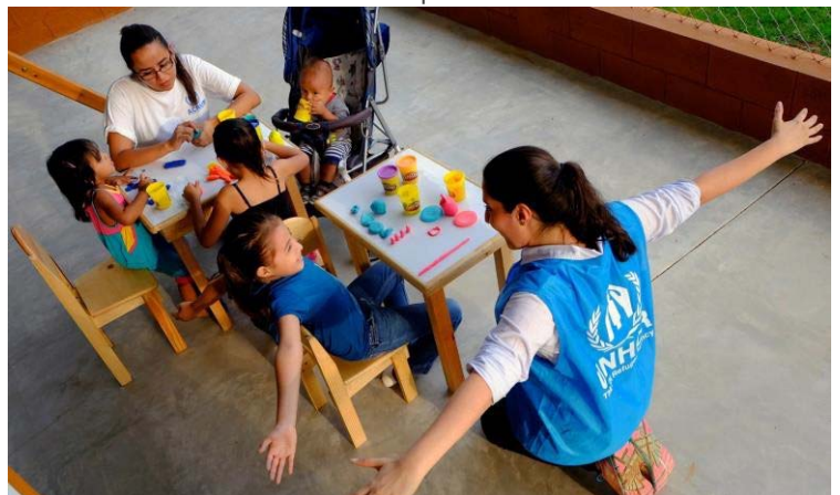
Las familias encuentran seguridad en los albergues financiados por el ACNUR.

En enero se completó un curso de introducción de dos semanas sobre los criterios y procedimientos para la determinación de la condición de refugiado , para un total de 29 funcionarios de la COMAR. Se espera que con este esfuerzo se amplíe el acceso al asilo, se aliviane y se facilite los procesos de toma de decisiones y de documentación bajo la responsabilidad de la COMAR. Además de la QAI, se estableció un mecanismo cuadripartito entre el