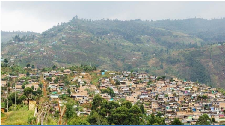
Panorámica Vereda Granizal. 2012