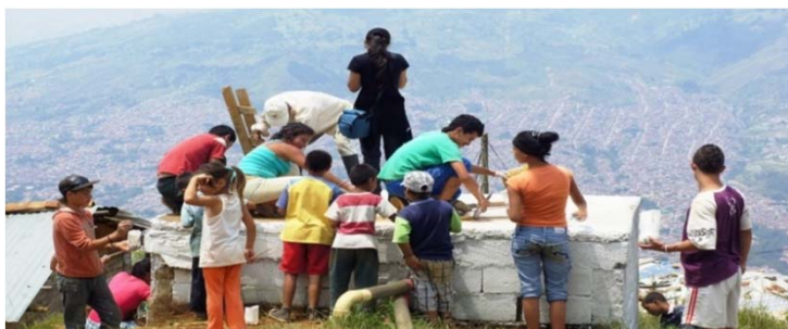
Niñas/os, Jóvenes de Granizal. 2012