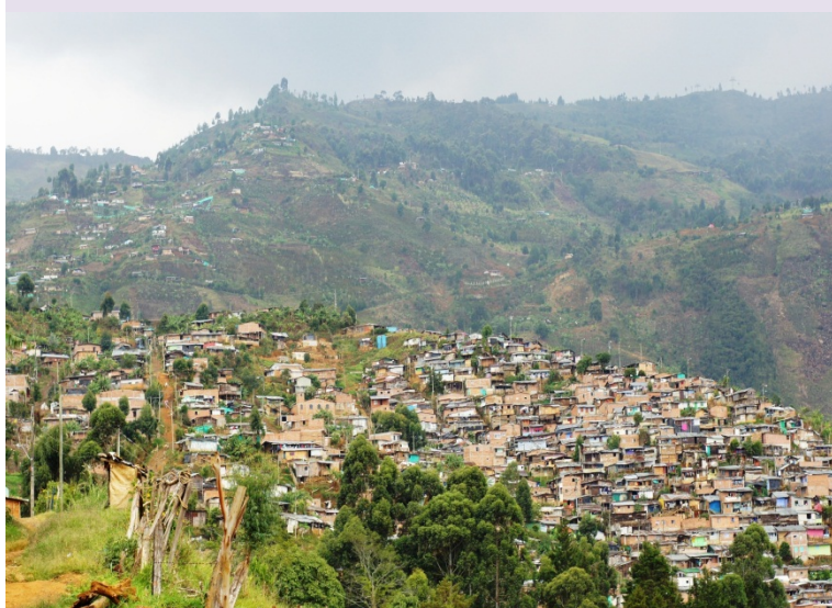
Panorámica Vereda Granizal. 2012

• Se avanzó en la propuesta de caracterización sociodemográfica basada en Indicadores Goce Efectivo Derechos a través del Proceso con la Universidad Autónoma Latinoamericana.