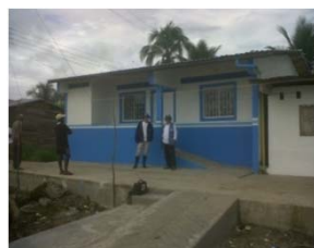
Puesto de Salud Tanguí 2012