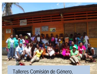
Talleres Comisión de Género, 2013