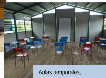
Aulas temporales, 2013