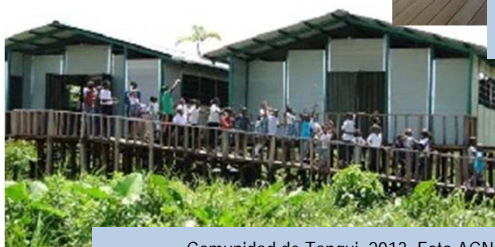
Comunidad de Tanguí, 2013.