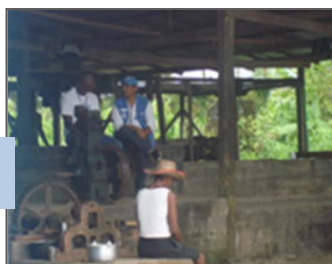
Molino de caña de azúcar, 2012