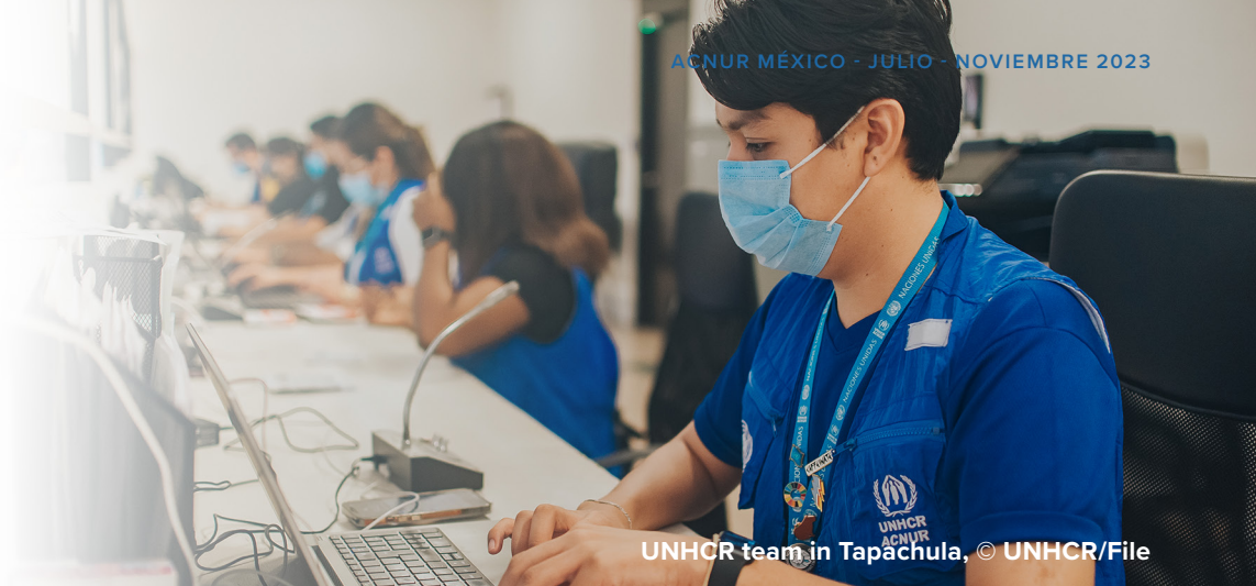
UNHCR team in Tapachula