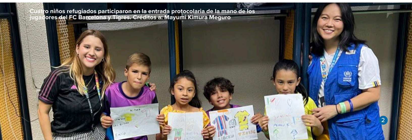
Cuatro niños refugiados participaron en la entrada protocolaria de la mano de los jugadores del FC Barcelona y Tigres.

En los últimos meses, México también ha experimentado un aumento del desplazamiento interno , generado por un incremento de la violencia perpetrada por grupos delictivos y disputas por la tierra en al menos siete estados. Según la Comisión Mexicana de Defensa y Promoción de los Derechos Humanos (CMDPDH), más de 379,000 personas fueron desplazadas en México por incidentes de violencia entre 2006 y 2021. Según las cifras de esta ONG, se calcula que para finales de 2023 habrá 30,000 desplazados internos más.