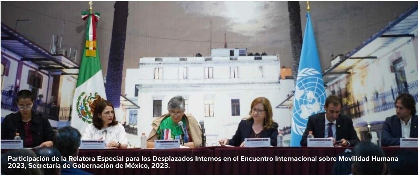
Participación de la Relatora Especial para los Desplazados Internos en el Encuentro Internacional sobre Movilidad Humana 2023, Secretaría de Gobernación de México, 2023.