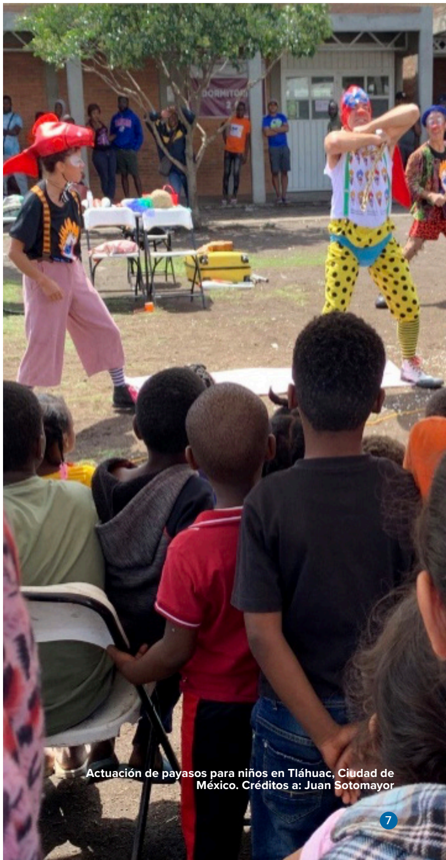
Actuación de payasos para niños en Tláhuac, Ciudad de México.

El proyecto de convivencia pacífica “Acojamos la ópera” busca sensibilizar a la comunidad mexicana de acogida sobre la realidad de los refugiados a través de un musical. La pieza, que presenta la realidad del desplazamiento forzado, ha llegado a más de 400 personas en sus tres primeras presentaciones.