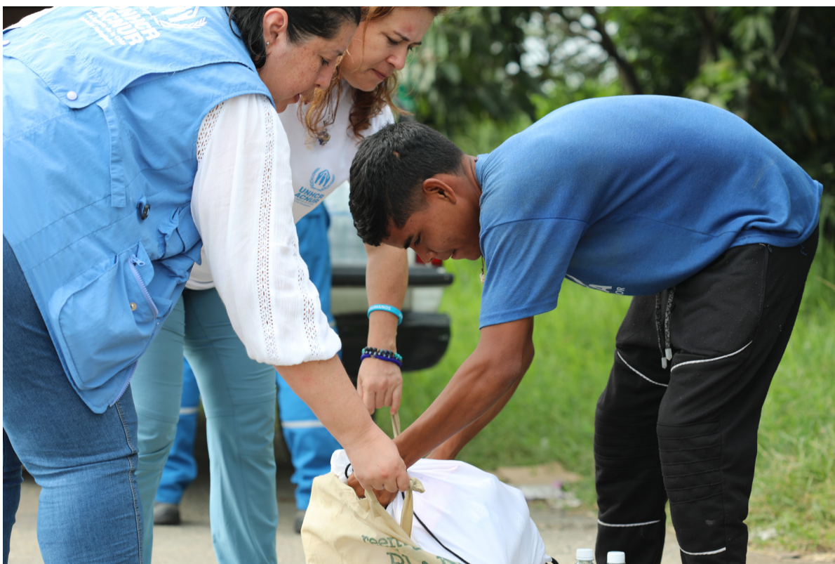
El ACNUR Valle del Cauca, ayuda a los venezolanos a caminar a través de Colombia con kits de alimentos e higiene para que puedan continuar su viaje.

Colombia está pasando por una transición y reconfiguración importante con la implementación del Acuerdo de paz con las FARC en 2016. A la vez, el país enfrenta retos humanitarios significativos, generados por la llegada masiva de refugiados y migrantes de Venezuela.