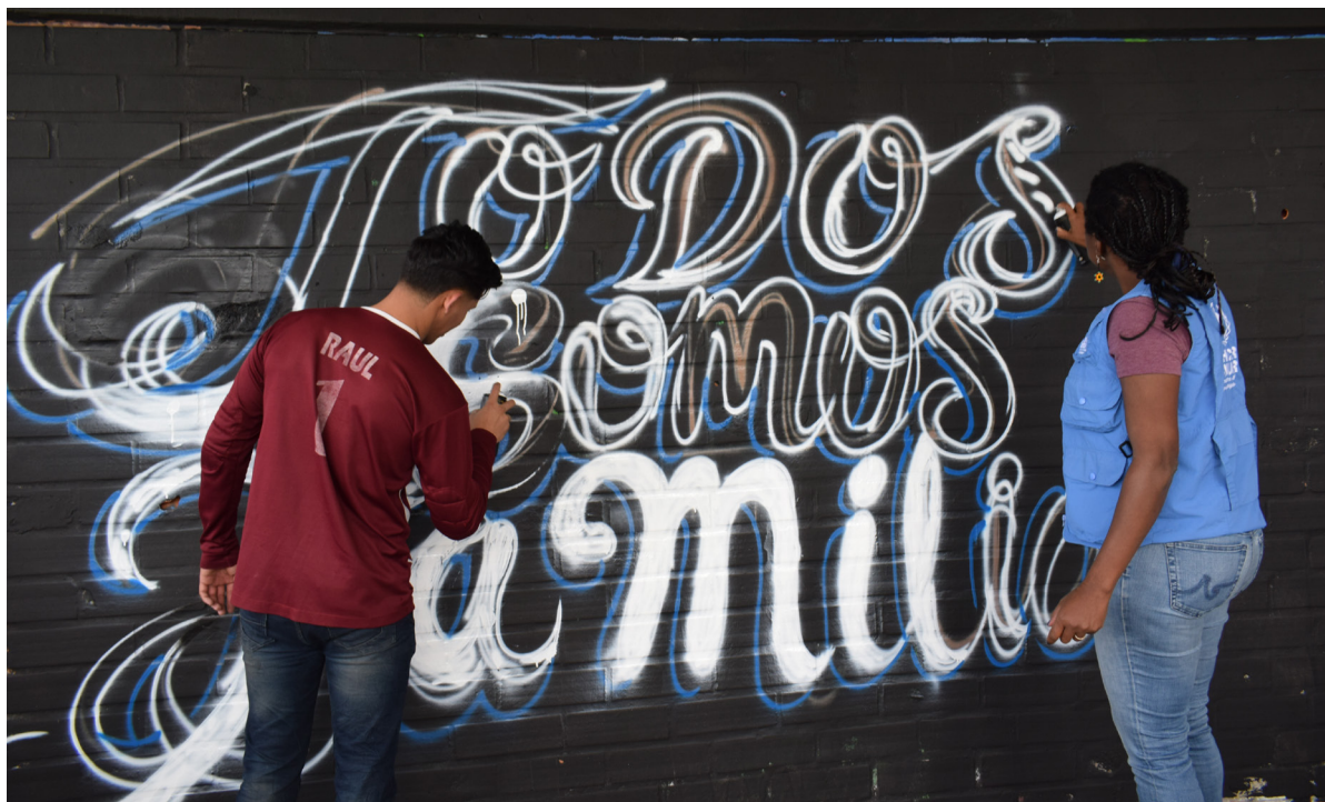
El ACNUR Medellín apoya una iniciativa comunitaria de arte callejero de jóvenes venezolanos y colombianos para fomentar la solidaridad entre las dos comunidades.

ACNUR ha establecido 20 Puntos de Atención y Orientación (PAO), en los que 16,307 personas han sido asistidas en 11 departamentos, a través de la difusión de información para refugiados, migrantes y desplazados internos, la identificación de diferentes perfiles en necesidad protección, y el seguimiento de casos a través de las oficinas de terreno.