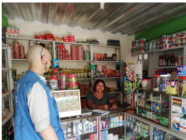
Personal de ACNUR visita unidades de generación de ingresos e iniciativas de emprendimiento en la comunidad de Villa Rosas, Mocoa (Putumayo)