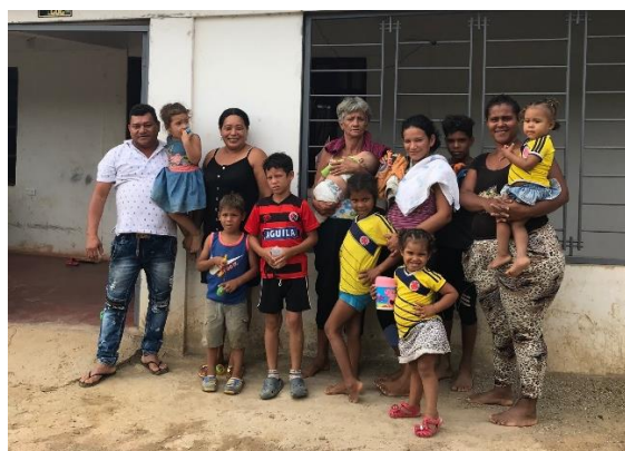
Población de interés de ACNUR en Las Delicias.

Adicionalmente, sí los venezolanos acceden al mercado laboral por la vía legal, se reducirán los incentivos para involucrarse en trabajos ilegales o actividades ilícitas . Ya hay evidencia de que la población venezolana, se han involucrado en trabajos ilícitos, como por ejemplo, se han unido a grupos armados al margen de la ley, se han inmiscuido en cultivos de coca y en prácticas de trabajo sexual. Del mismo modo, esto representa riesgos de protección altos para dicha población, ya que muchos terminan en actividades ilícitas de manera involuntaria, convirtiéndose en población objetivo para explotación infantil, explotación laboral y/o tráfico de personas