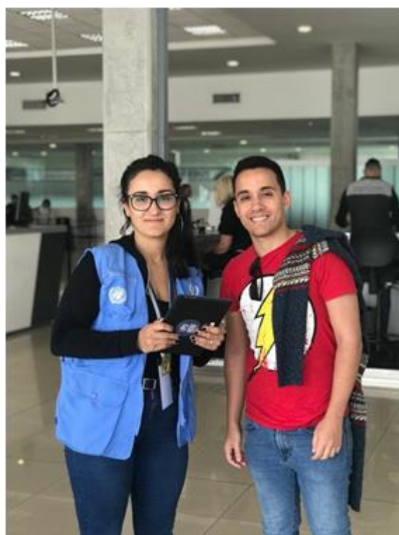
Venezolano siendo aconsejado por personal del ACNUR durante uno de los ejercicios de monitoreo de protección en Colonia

Otro 36% indicó no tener información sobre el procedimiento para solicitar la condición de refugiado. El ACNUR infiere que el desconocimiento sobre la posibilidad de solicitar protección internacional en Uruguay es uno de los factores relevantes que explica el hecho de que la población venezolana entrevistada no haya solicitado su reconocimiento como refugiado en el país.