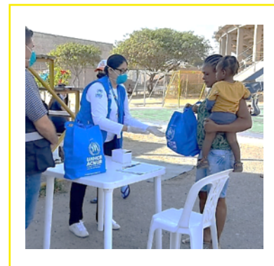
Familias en Tacna reciben kits de comida.

En Arequipa, unas 75 personas refugiadas y migrantes fueron remitidas a organizaciones religiosas locales para recibir canastas de alimentos en sus listas de distribuciones.