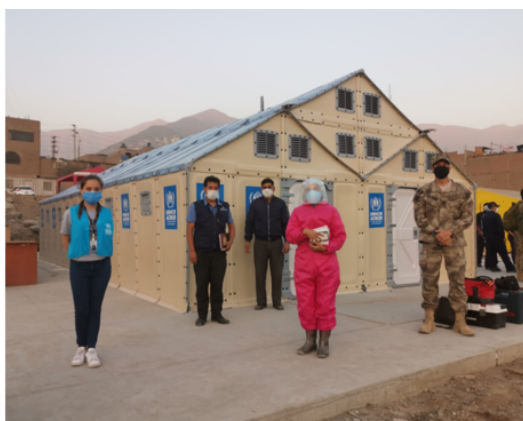
Instalación de Unidades de Vivienda para mejorar la respuesta hospitalaria en Lima.

Se realizaron más de 720 orientaciones en salud primaria y otras consultas de salud en Lima y Tumbes por ACNUR y sus socios.