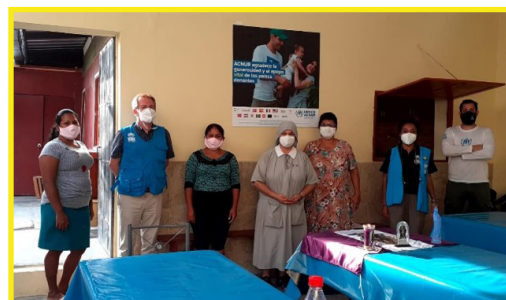
Comedor Hermanas de Santa Ana

Más de 4.400 kits han sido distribuidos por ACNUR y sus socios, que incluyen kits para bebés en Tacna y Cusco, kits de higiene en Lima, y mosquiteros, máscaras, ropa y utensilios de cocina distribuidos en Arequipa, Lima, Cusco, Tacna y Tumbes. Además, se han distribuido unas 17.400 mantas en Apurímac, Arequipa, Cusco, Lima y Tacna desde el inicio de la Emergencia para mejorar la capacidad de camas hospitalarias, y para enfrentar el invierno.