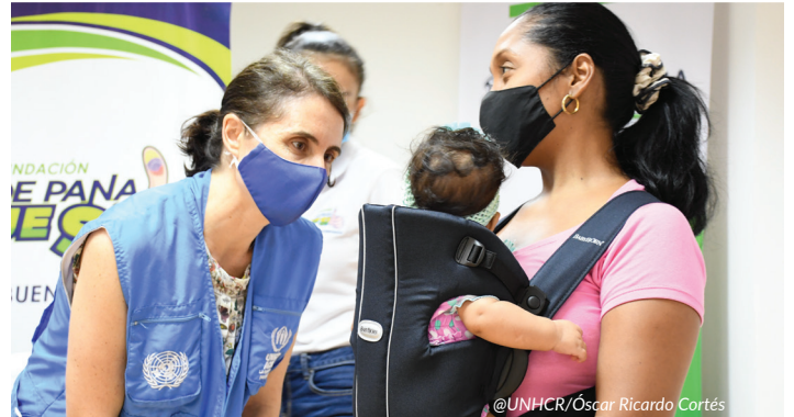
ACNUR Barranquilla dotando portabebés a madres venezolanas con necesidades específicas de protección (2021).