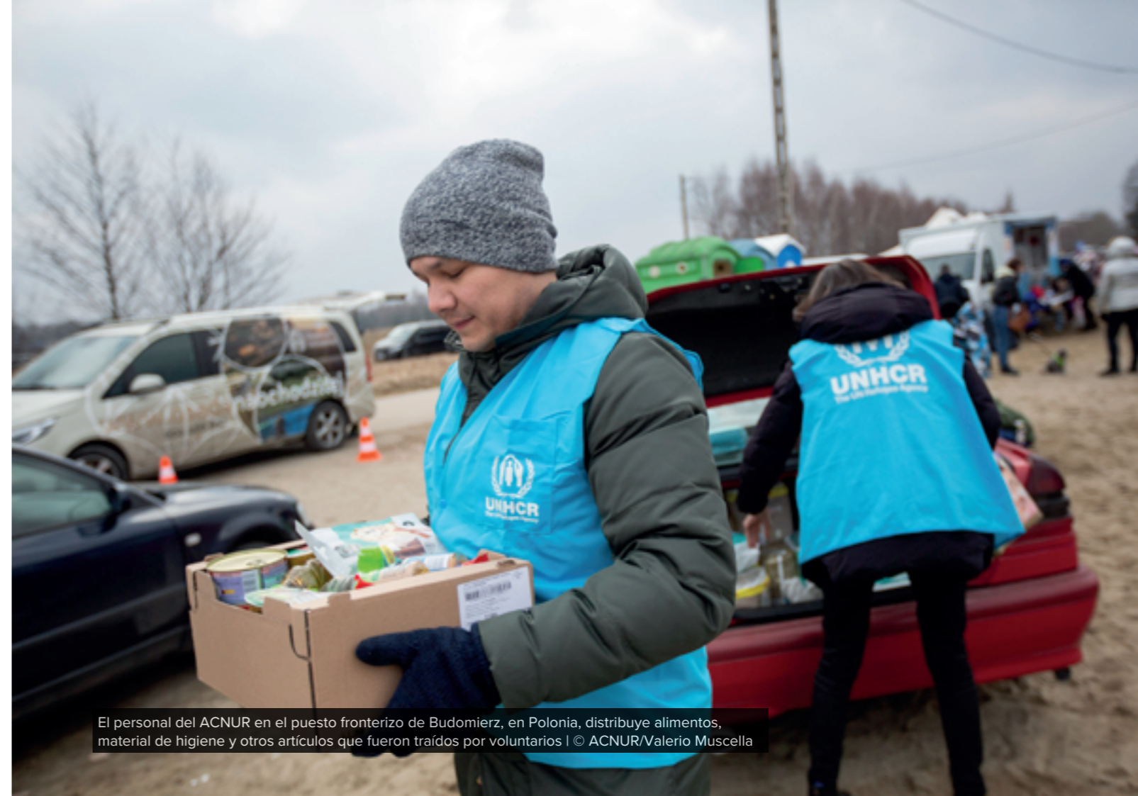
El personal del ACNUR en el puesto fronterizo de Budomierz, en Polonia, distribuye alimentos, material de higiene y otros artículos que fueron traídos por voluntarios