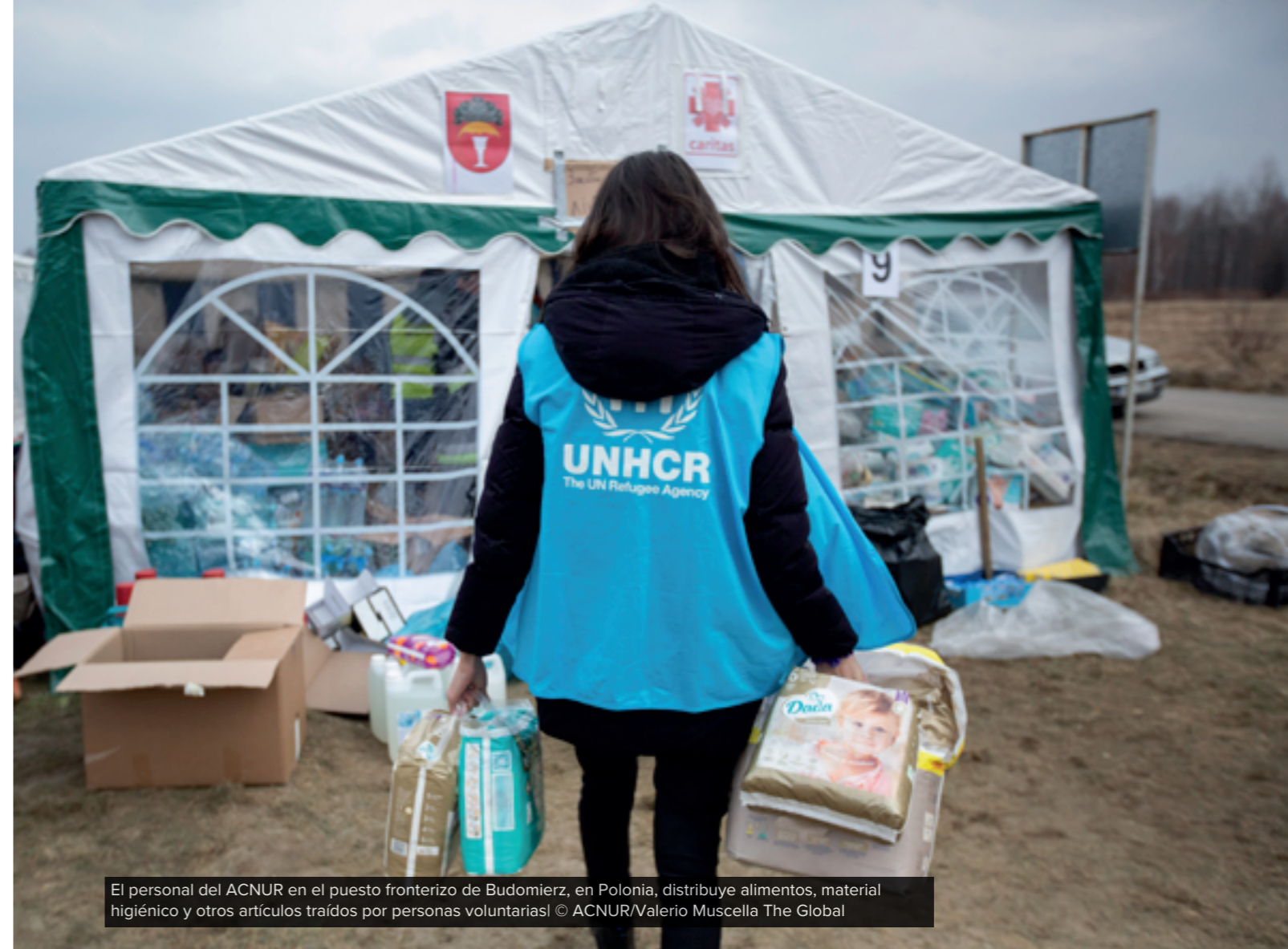
El personal del ACNUR en el puesto fronterizo de Budomierz, en Polonia, distribuye alimentos, material higiénico y otros artículos traídos por personas voluntarias The Global

La página de situación de Global Focus para la situación de Ucrania puede encontrarse aquí (en inglés).