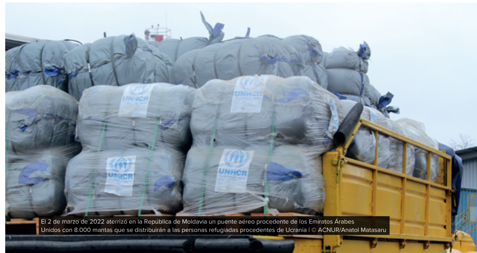
El 2 de marzo de 2022 aterrizó en la República de Moldavia un puente aéreo procedente de los Emiratos Árabes Unidos con 8.000 mantas que se distribuirán a las personas refugiadas procedentes de Ucrania

El ACNUR está evaluando la viabilidad de distribuir dinero de emergencia en efectivo a través de tarjetas bancarias a las personas recién llegadas en varios países, entre ellos Polonia y la República de Moldavia . Asimismo, se prevén programas de dinero en efectivo sin restricciones en otros países afectados por estar en la primera línea. En la República de Moldavia , el ACNUR está trabajando con sus socios para iniciar la distribución de dinero en efectivo de emergencia a pequeña escala en un centro temporal, inicialmente centrándose en casos específicos mientras se establece el mecanismo de asistencia a mayor escala. Para ello, el ACNUR está debatiendo con los proveedores de servicios financieros y las autoridades competentes el establecimiento de un sistema electrónico de entrega de dinero en efectivo. Se ha creado un Grupo de Trabajo sobre Dinero en Efectivo, copresidido por el ACNUR y por el Ministerio de Salud, Trabajo y Protección Social, para ayudar a coordinar la entrega de ayuda en efectivo.