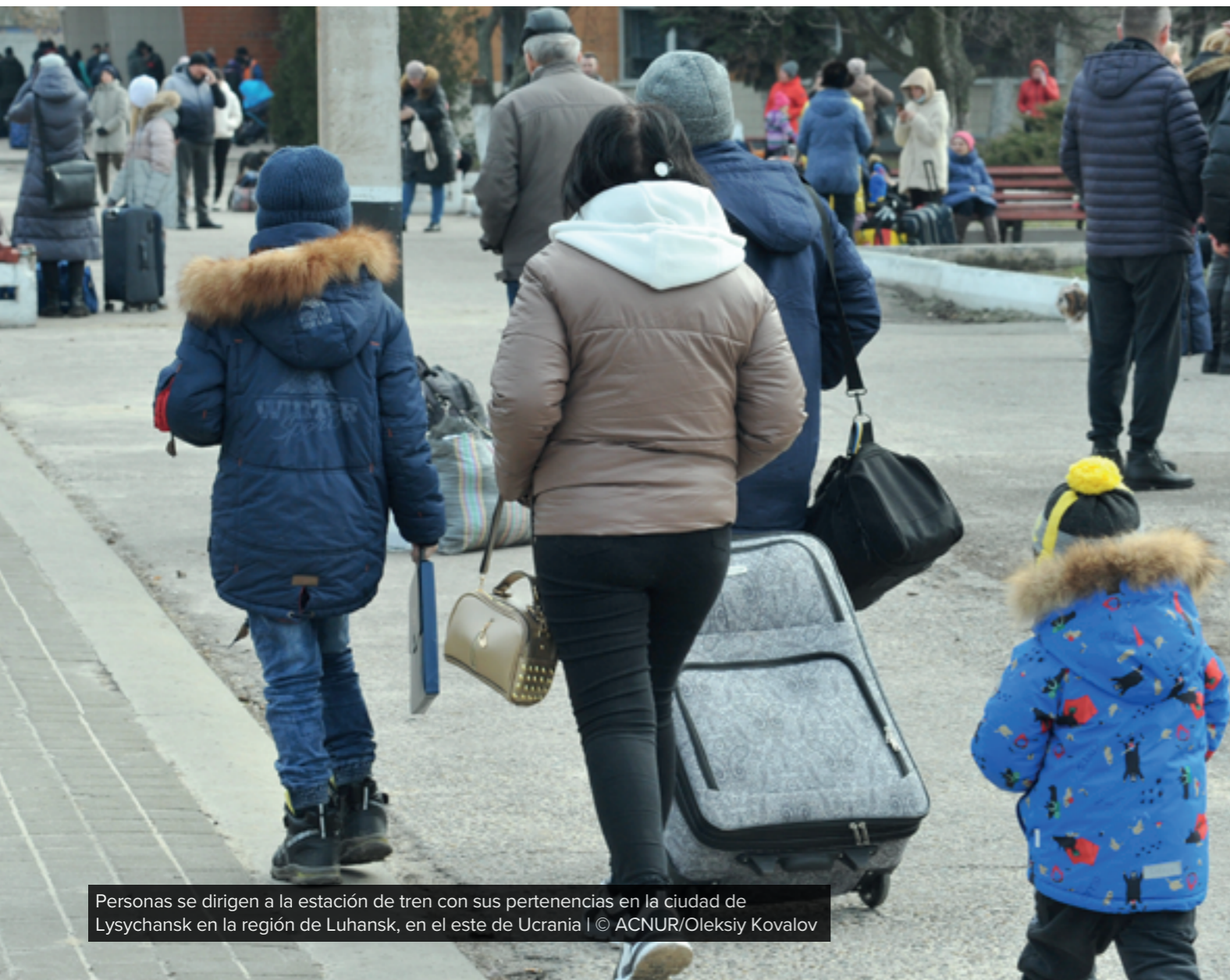
Personas se dirigen a la estación de tren con sus pertenencias en la ciudad de Lysychansk en la región de Luhansk, en el este de Ucrania