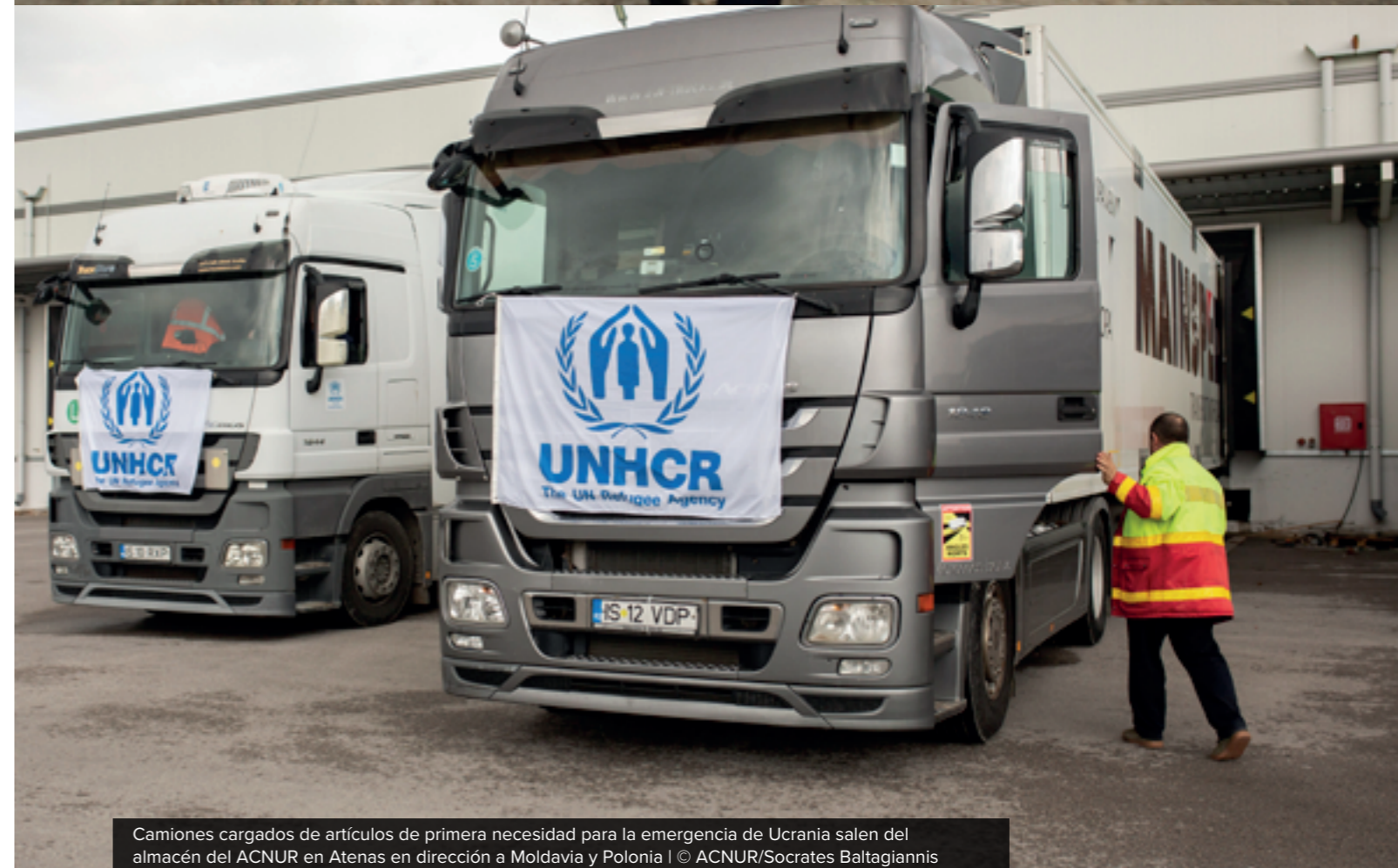
Camiones cargados de artículos de primera necesidad para la emergencia de Ucrania salen del almacén del ACNUR en Atenas en dirección a Moldavia y Polonia