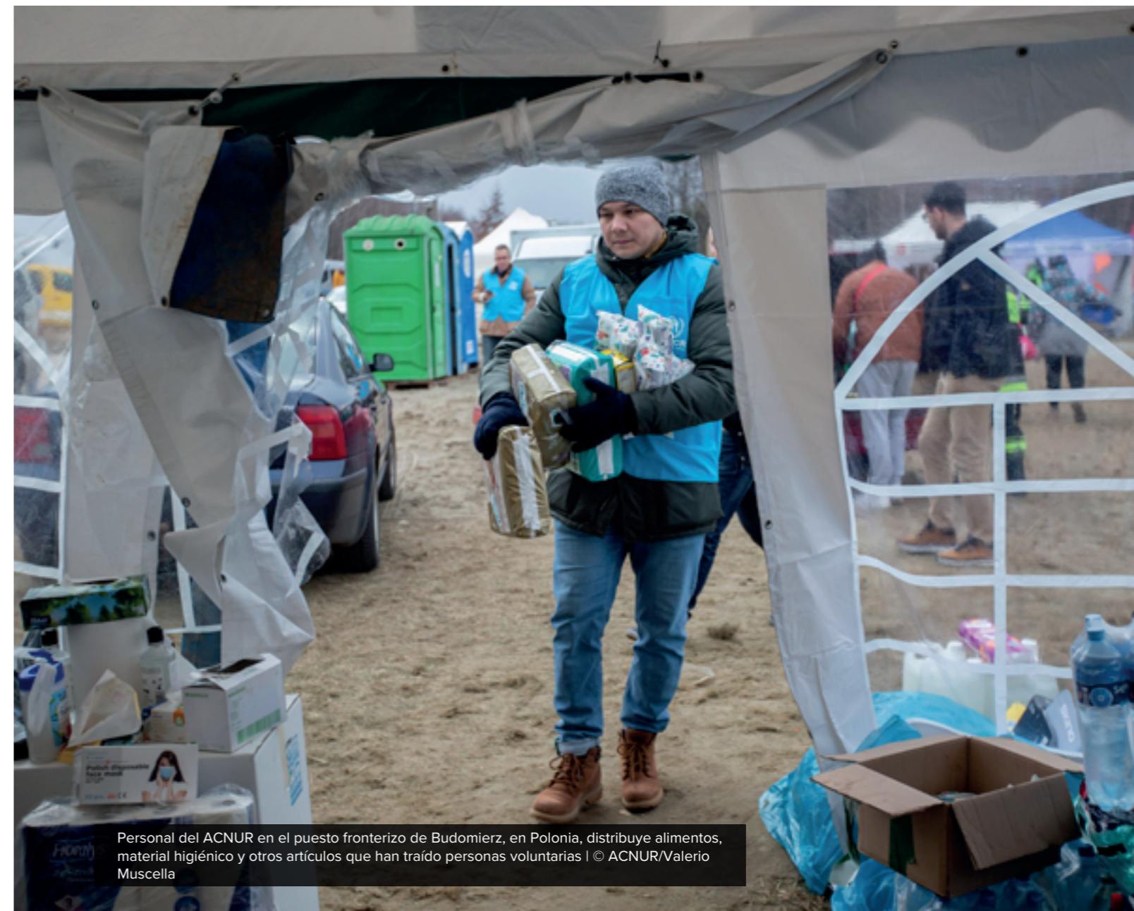
Personal del ACNUR en el puesto fronterizo de Budomierz, en Polonia, distribuye alimentos, material higiénico y otros artículos que han traído personas voluntarias

En los países en los que sea necesario, el ACNUR proporcionará albergues de emergencia y trabajará con las autoridades para establecer instalaciones de recepción y/o de tránsito temporales.