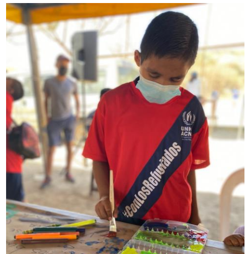
Niño participando en actividades lúdicas en la Feria de Integración en Villa Nueva, Departamento de Guatemala.