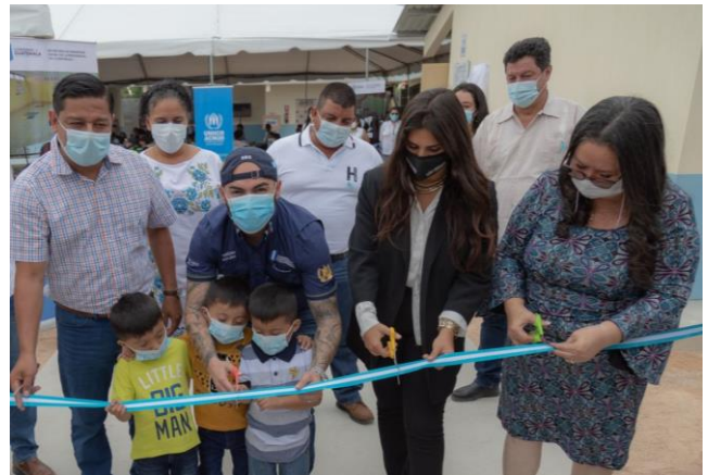
Inauguración del nuevo Centro de Atención Integral Infantil en Santa Elena, Flores, Petén, por parte del Secretario de la SBS, la alcaldesa de Flores y ACNUR.