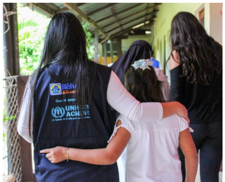
ACNUR con organizaciones socias como Refugio de la Niñez y la Iglesia Católica brindan acompañamiento integral a niñez con necesidades de protección internacional. Foto tomada en la Casa Hogar Santo Domingo en Santa Elena, Flores, Petén.

A través de alianzas como la reciente firma de la Carta de Entendimiento entre ACNUR y el Consejo Nacional de la Juventud (CONJUVE) , institución rectora en los asuntos y políticas públicas a favor de la juventud, se promueve la inclusión de jóvenes refugiados en las políticas nacionales.