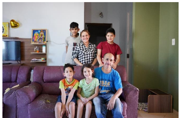
Familia venezolana comienza una nueva vida en Asunción.