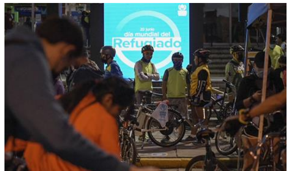
Bici Tour Día Mundial del Refugiado 2022.