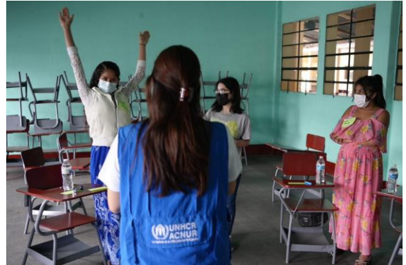
Actividad de retroalimentación con las comunidades.