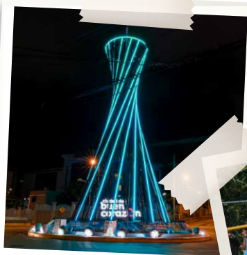
Una luz encendida por la resiliencia, la inclusión y el compromiso de construir una ciudad donde todas las personas puedan sentirse en casa.