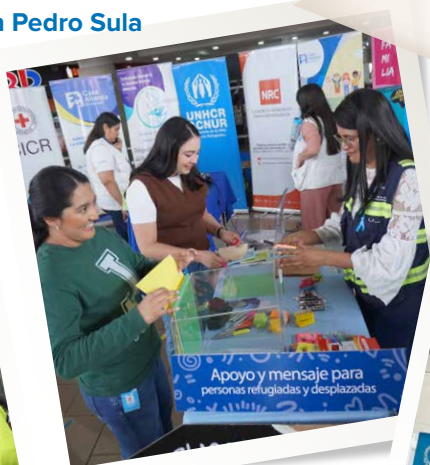
Las comunidades se sumaron a proteger el derecho a vivir en paz y para integrar con dignidad a quienes llegan huyendo de la violencia.