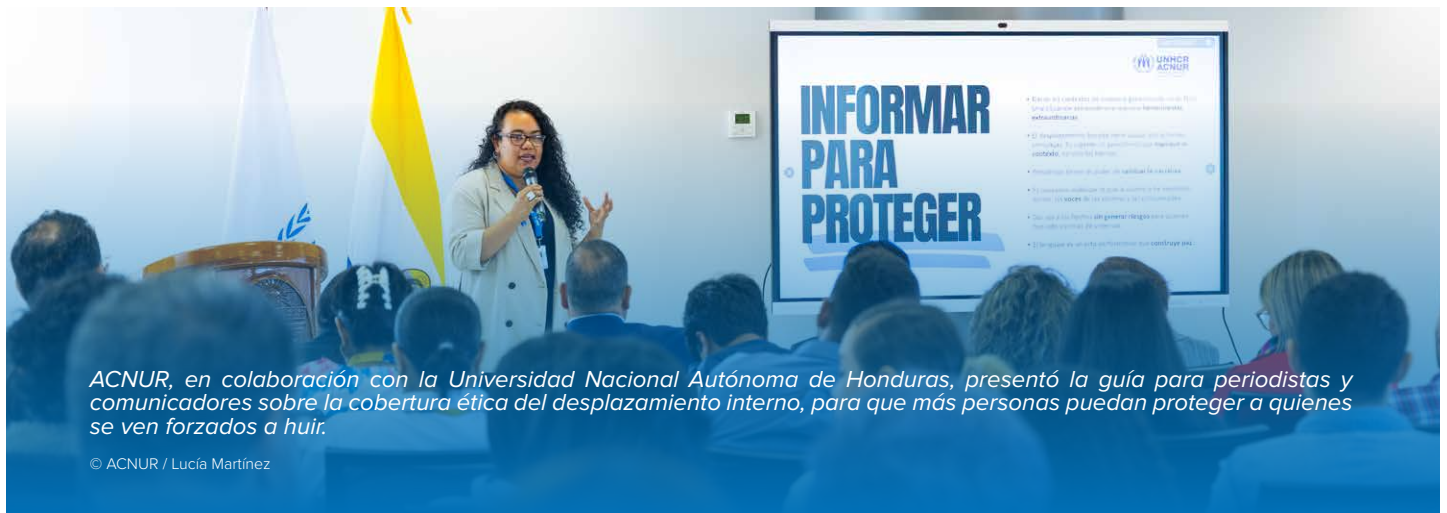
ACNUR, en colaboración con la Universidad Nacional Autónoma de Honduras, presentó la guía para periodistas y comunicadores sobre la cobertura ética del desplazamiento interno, para que más personas puedan proteger a quienes se ven forzados a huir.

El 24 de junio, ACNUR, en colaboración con la Universidad Nacional Autónoma de Honduras, presentó la guía para periodistas y comunicadores sobre la cobertura ética del desplazamiento interno , centrada en reducir los riesgos que enfrentan las personas desplazadas cuando su situación se expone públicamente, así como quienes informan al respecto.