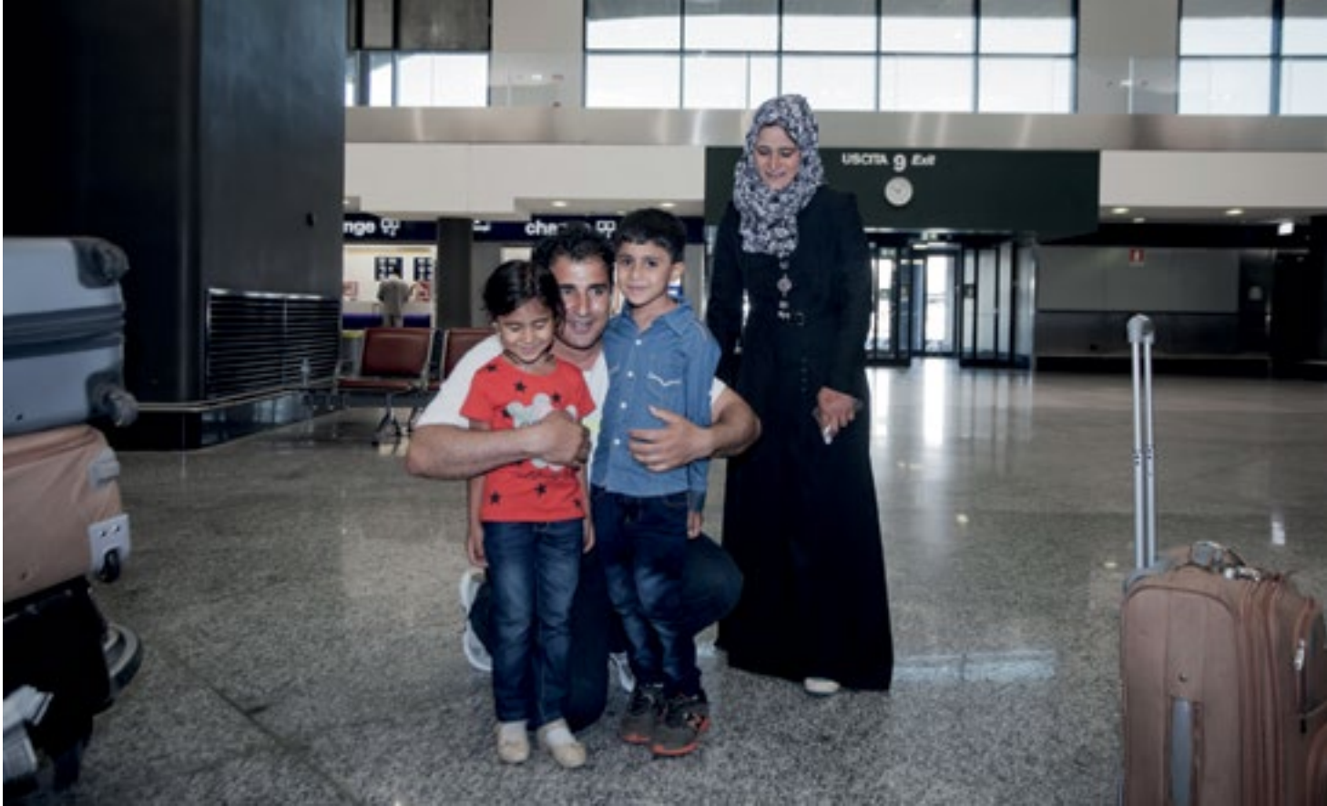
En el Aeropuerto Malpensa, un refugiado de Egipto que vive en Milán se reúne con su esposa e hijos después de dos años de separación. © ACNUR / C. Russo / Julio de 2016