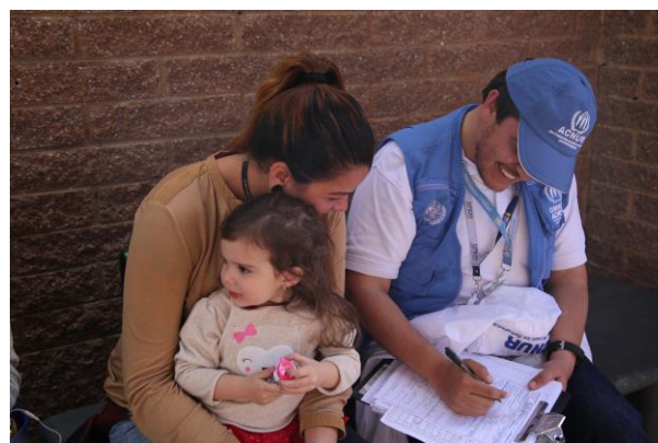
ACNUR durante la jornada de Registro de Venezolanos (RAMV) en Soacha, Bogotá.