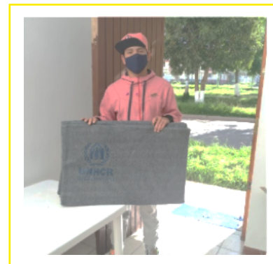
Familias en Tacna reciben mantas en preparación para el invierno.

-En Cusco se distribuyeron mantas por la pronta llegada del invierno. Hasta el momento más de 790 familias vulnerables recibieron este apoyo.