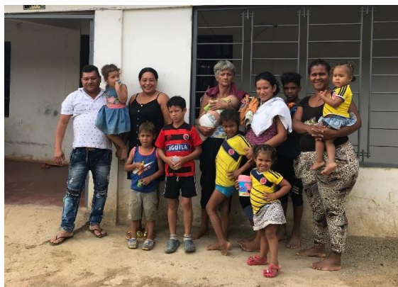
Venezolanos recién llegados a Las Delicias.

Ante el contexto actual de COVID-19, la generación de ingresos y los medios de vida de la población venezolana se han visto gravemente afectados . La mayoría de las personas refugiadas y migrantes se encuentran en situación de irregularidad, por lo que sus sustentos diarios provienen del ejercicio de actividades informales como las ventas ambulantes. Dada las medidas de aislamiento preventivo obligatorio tomadas por el Gobierno Nacional desde el mes de marzo, muchas familias se han visto expuestas ante la necesidad de retornar a su país en condiciones no favorables, ante el riesgo de permanecer en situación de calle y no poder cubrir sus gastos básicos para permanecer en Colombia.