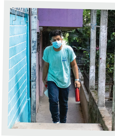
* Nombre cambiado por motivos de protección.