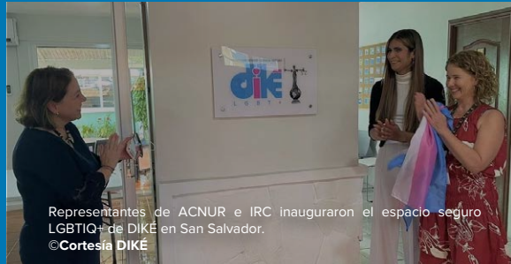
Representantes de ACNUR e IRC inauguraron el espacio seguro LGBTQI+ de DIKÉ en San Salvador.

ACNUR se unió a otras 14 organizaciones en una feria interinstitucional de servicios organizada por el municipio de Santa Ana junto a la OIM. ACNUR proporcionó información sobre su mandato y los servicios que brinda a las personas desplazadas internas y en riesgo de desplazamiento a través de los Espacios de Apoyo y las unidades móviles.