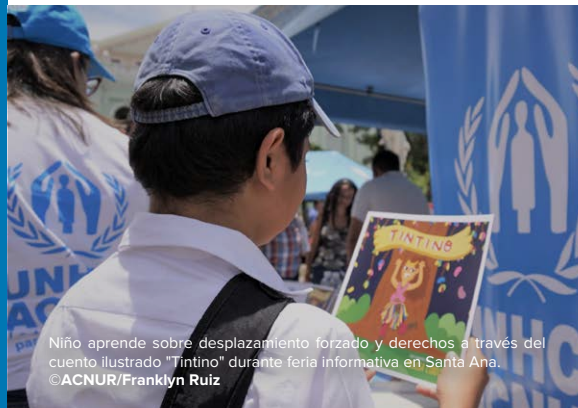
Niño aprende sobre desplazamiento forzado y derechos a través del cuento ilustrado "Tintino" durante feria informativa en Santa Ana.

ACNUR probó su nuevo ChatBot – “A Tu Lado” en línea, una herramienta de mensajería instantánea con preguntas y respuestas sobre ACNUR, con un grupo de voluntarios comunitarios para evaluar la accesibilidad con usuarios de diferentes contextos y conocimiento tecnológico. La herramienta incluye información y respuestas automáticas sobre 15 temas diferentes, incluido el acceso al asilo en el país y las actividades de ACNUR. El lanzamiento del chatbot está previsto para finales de agosto.